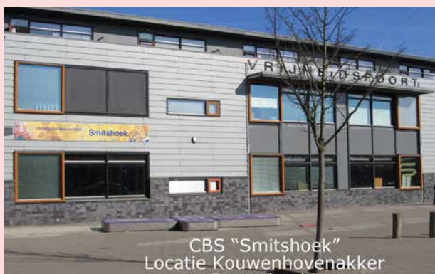
CBS "Smitshoek" Locatie Kouwenhoven-akker Barendrecht

Telefoon 0180-556999 e-mail info_smitshoek@pcpobr.nl website www.cbssmitshoek.nl