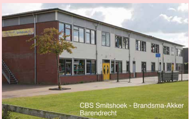
CBS Smitshoek - Brandsma-Akker Barendrecht

Telefoon 0180-627878 e-mail info_smitshoek@pcpobr.nl website www.cbssmitshoek.nl